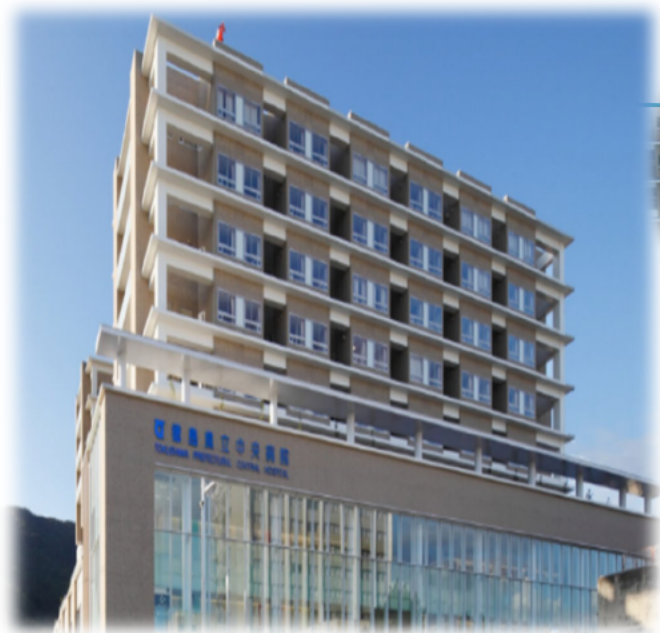
徳島県立中央病院