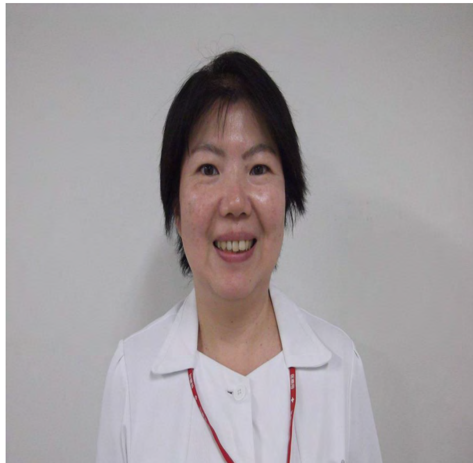
緩和ケア認定看護師