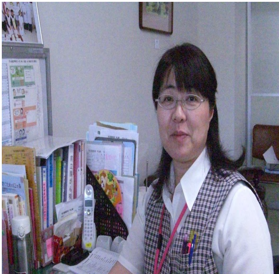
相談員基礎研修Ⅲ 修了者(事務員)