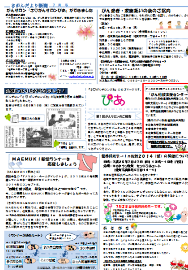
さがんだより新聞

また、佐賀県武雄市在住のがん予防推進員らの会合では、地域の人にがんの相談をよく受けることがあるという方々に、がん相談支援センターを紹介しました。