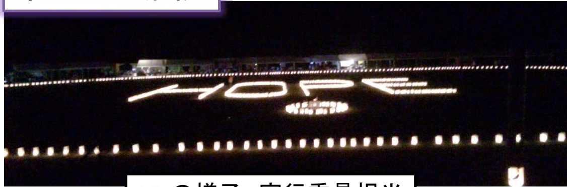
RFLの様子、実行委員担当