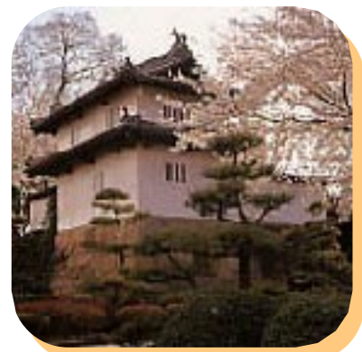
高崎城乾櫓