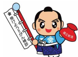
福岡県がん検診受診率向上イメージキャラクター「健診くん」

お申込み方法：どなたでも参加できますが、事前の申し込みが必要です。裏面をご覧ください。